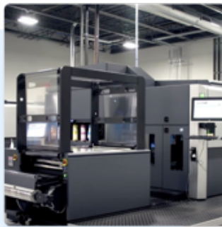
Kemasan Fleksibel Digital Pertama di Indonesia (Est. 2020)

FlexyPack adalah perusahaan kemasan fleksibel digital terkemuka yang bertujuan untuk membantu 65+ juta UMKM di Indonesia mengembangkan bisnis mereka melalui pengemasan yang efektif dengan kuantitas pesanan rendah, bahan berkualitas tinggi, harga terjangkau, dan desain yang inovatif.